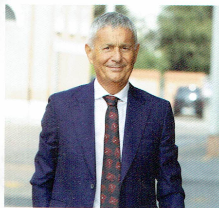
Ivano Vacondio, presidente Federalimentare

L'industria alimentare non ha mai chiuso i battenti, anzi lavora a pieno regime fin dall'inizio dell'emergenza sanitaria provocata dal Covid-19. Il cibo italiano raggiunge le tavole di tutti, in Italia e all'estero, al netto dei rallentamenti dovuti ai controlli alle frontiere e alle criticità logistiche. Appuntamenti fieristici centrali come Vinitaly e Cibus sono stati rinviati o posticipati all'anno prossimo, ma almeno il rischio di un danno all'immagine e alla reputazione del made in Italy dei primi momenti si è ridotto con la diffusione della pandemia